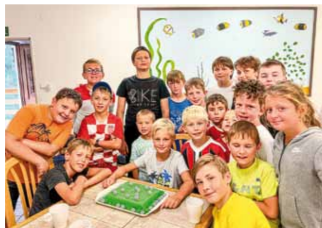
Stylový dárek pro fotbalistu k svátku – dort ve tvaru hřiště.

i na výlet. Poskytl nám na celý den bezplatně svůj autobus. Staral se o nás, měl tam své dva syny, a dovezl nás, kam jsme potřebovali. Díky zajištěné dopravě jsme mohli vyrazit na celodenní výlet do Safari v Hluboké u Borovan.“