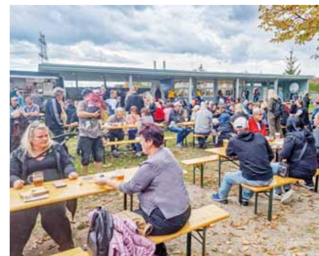
Loňský první ročník se vydařil!