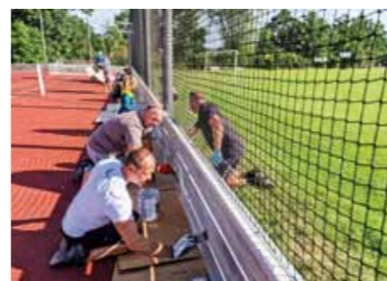
Čtrnáct štětců pro natěrače nestačilo...

Na pěší stezku z Úsilného na Borek, po pravé hrázi rybníka Na Pláništích, sice z centra obce nedohlédneme, ale je již vyzkoušená a všemi chválená. Doufejme, že bude dlouho sloužit všem.