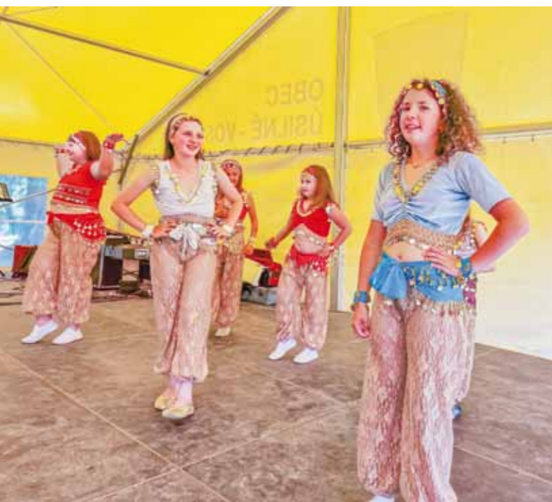
Úsměvy na tváři po dotancování...