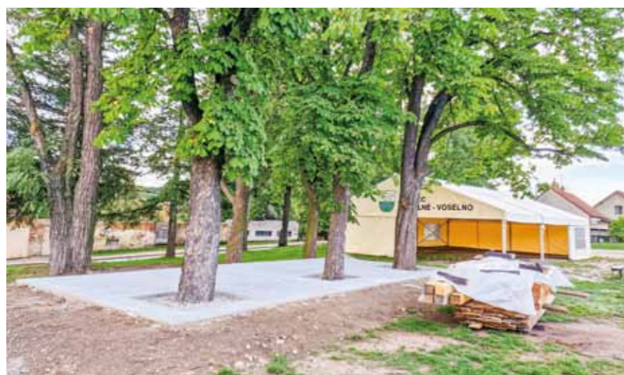
Základy jsou základ.

tam se o prvním zářijovém víkendu odehrála z popudu několika, většinou nových sousedů zajímavá a bohubíba akce. Pro mnohé mladší ročníky zní výrazy jako „Akce Z“ nebo „sobotní brigáda“ jako cizí slova. Ale opravdu, sešlo se možná dvacet dobrovolníků včetně několika dětí a natřeli jsme větší část venkovních dřevěných konstrukcí víceúčelového hřiště. Samozřejmě muselo být slíbené pivo a pečené maso. A když už se roztopí pec, aby se náležitě využila, zapojily se i naše dámy a další děti a upekly