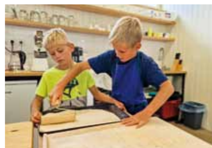
Natírání hřiště s doprovodným pečením – smyslem akce bylo také inspirovat děti k manuální zručnosti a vést je k pracovním dovednostem.

A když zaostříte ještě dál, na fotbalové hřiště – tam přece stávaly buňky se zastřešenou terasou. Už nestojí, sportovci je také „brigádně“ rozebrali a místo nich již začala výstavba zázemí sportovního klubu. Je to největší investiční akce v poslední době. Řídíme se