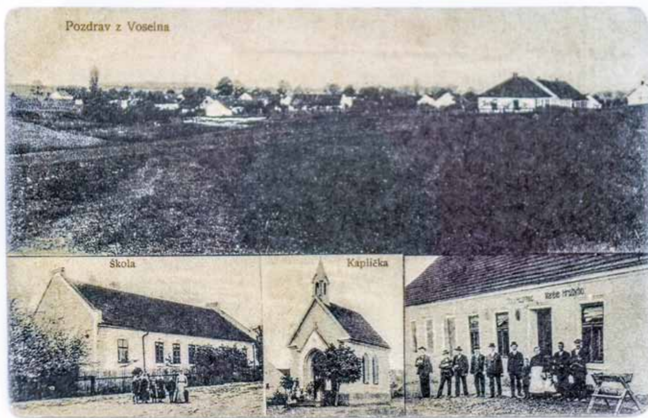
Dobová pohlednice s vyobrazením školy (dnes budova obecního úřadu).

Budovu školy postavili místní za půl roku