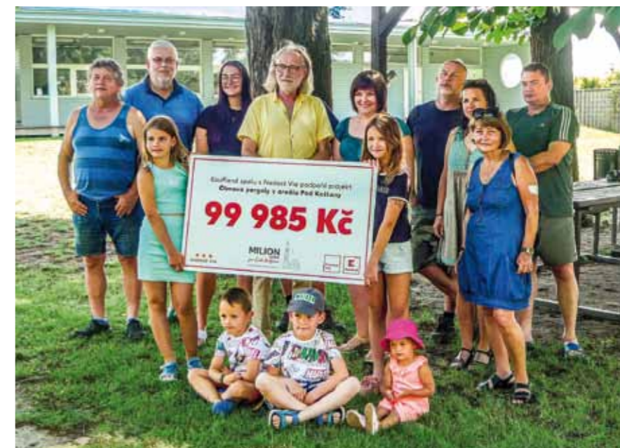
Peníze z grantu na novou pergolu Pod Kaštany.

bude chybět skákací hrad, řetězový kolotoč, Prvorepubliková kavárna, ani kouzelník Jura Magic s balónky. A v nové pergole bude veškeré občerstvení. Z Podkaštaní snadno dohlédnete na naše víceúčelové hřiště. Právě