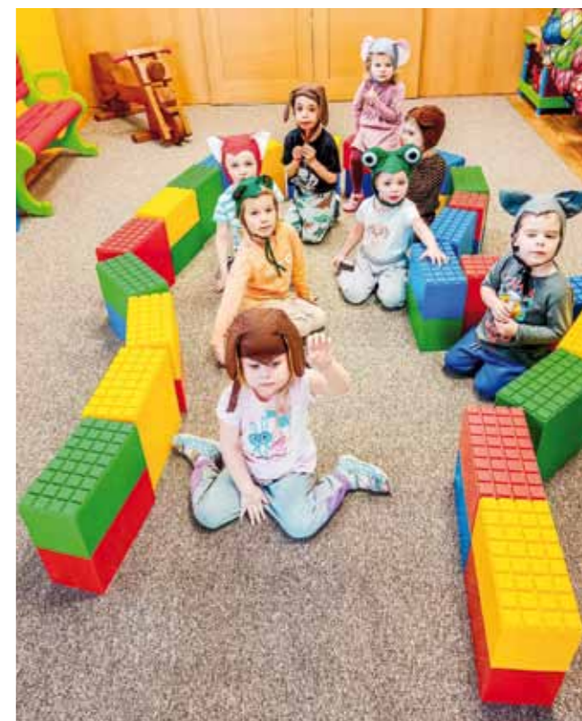
Scénické zpracování Pohádky o rukavici. Děti si rukavici vytvořily ze stavebnice.