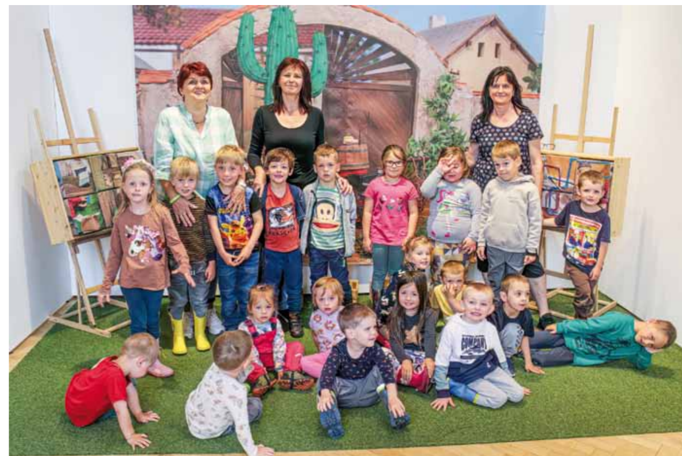
Velkým zážitkem se stala výstava Pat a Mat v Jihočeském muzeu.