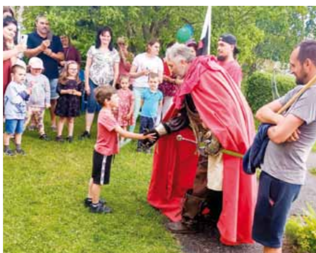
Pasování na školáky při zahradní slavnosti.

hlédneme výstavu a pak jsou pro nás připravené ateliéry, takové dílny, kde děti pod vedením lektorů samy tvoří. Hodně chodíme do muzea, nejvíc nás nedávno nadchla výstava Pat a Mat. I nás, dospělé,“ usmívá se.