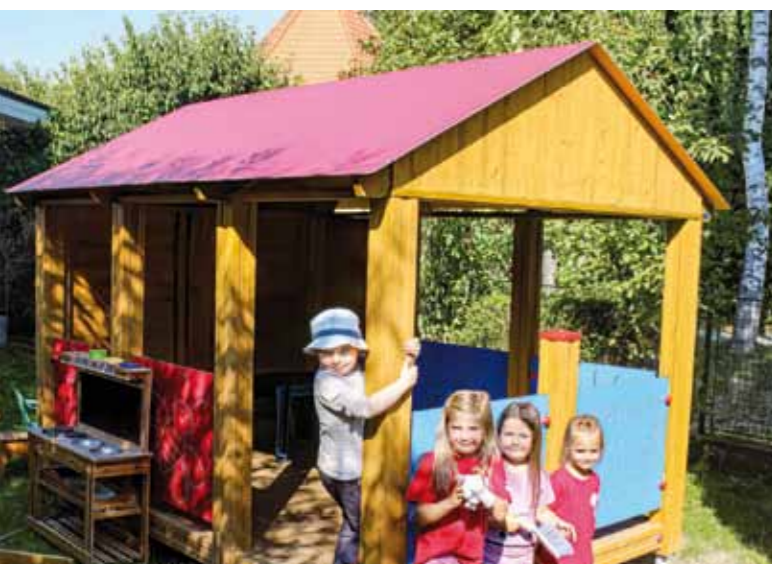
Nákup zahradního domku z části pokryl i sponzorský dar od voselského souseda Václava Hynka.